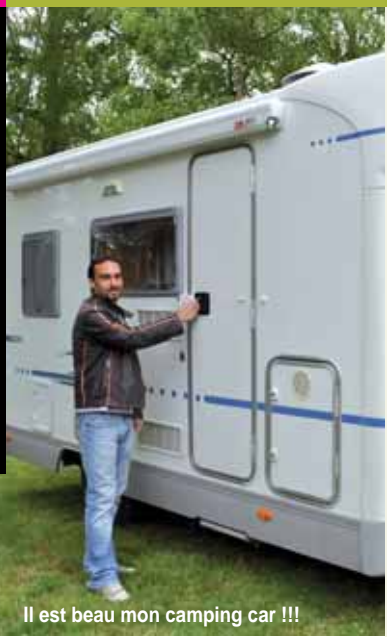
Il est beau mon camping car !!!