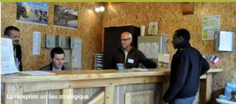
La réception un lieu stratégique.