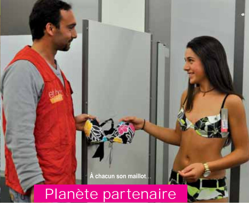
À chacun son maillot...